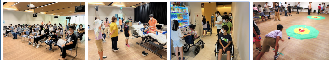
動画視聴・福祉クイズ

約350名の方に参加いただき、3年ぶりに世田谷区立保健医療福祉総合プラザ研修室Cで開催しました。「特別養護老人ホームのご紹介(動画)」「リハ・スポーツ(動画)」「介護ベッド・車いす・ポッチャ体験」や「福祉クイズ」を行い、「誰もが“幸せ”にくらせるまち」についてみんなで考えました。体験を通し、参加者の皆さんに楽しく学んでいただきました。