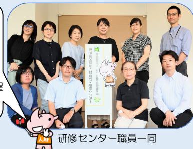
研修センター職員一同

隔月発行のじんざいくん便りは、福祉の理解・研修の情報などをお届けしています。ご意見・ご要望など、お寄せください。